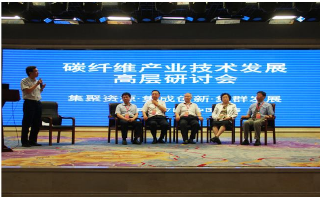
7月17日上午，出席碳纤维产业技术发展高层研讨会的专家学者现场答疑。

（二）提升回应社会关切和互动交流水平。2016年，围绕管委重点工作和公众关注热点，全区召开新闻推介会14次，对精准扶贫、全国首条中韩海运EMS速递邮路进出口业务、大众创业万众创新、碳纤维产业技术发展等政策进行解读宣传，为推进政策实施发挥了正向舆论引导作用。充分利用政务微博、微信等现代媒介，开通各部门微博、微信36个，及时发布各类信息1738条，切实方便公众随时随地第一时间获知相关信息。在区门户网站开通“主任信箱”、“意见征集”、“网上调查”等栏目，回复群众的建议、咨询、诉求690条，有效发挥了信息公开的政民互动“桥梁”和“纽带”作用。